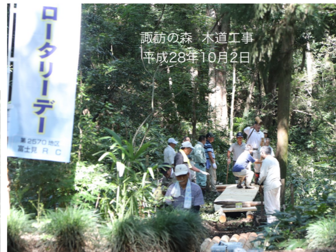
諏訪の森 木道工事 平成28年10月2日