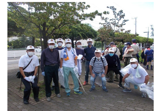
富士見RC参加の会員

例会日 毎週金曜日 時間 12:30~13:30 事務所 〒354-0022 富士見市山室2-10-10 島田ビル201号 電話 049-251-6596 FAX049-252-3848 例会場 島田ビル1F Eメール fujimi-rc@nifty.com